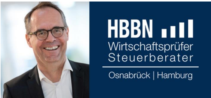
Osnabrück und Hamburg

„SPECTRUM sind für mich einfach die IT-Profis. Vielen Dank für den guten Support und Ihre langjährige Unterstützung in allen IT-Fragen!“